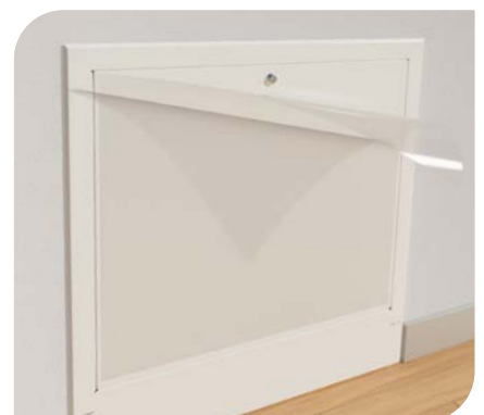
4. Folie abziehen ... fertig!