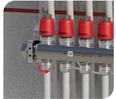
2. Hydraulische Installation der Verrohrung