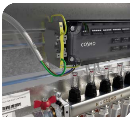
3. Anschluss der vorverdrahteten Stellantriebe